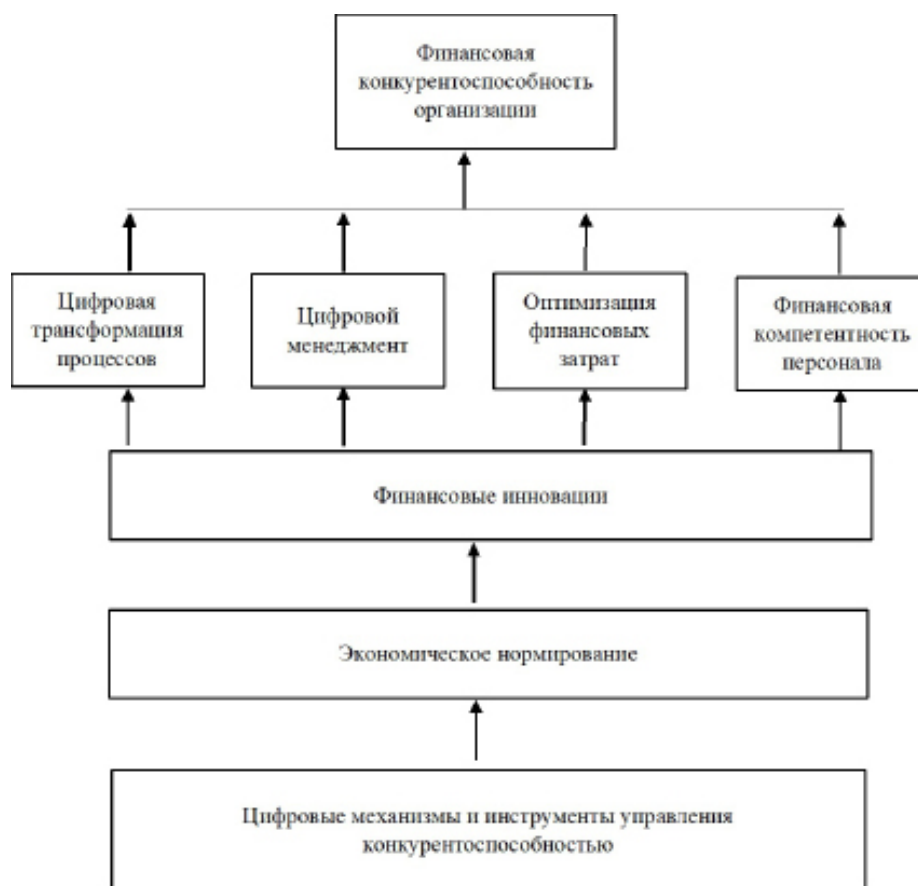
Рис. 2. Модель финансовой конкурентоспособности организации Fig. 2. Model of the organization's financial competitiveness

Усиление финансовой конкурентоспособности и повышение уровня международной активности предприятий становятся возможными при внедрении передовых цифровых технологий [4, с. 184]. Установление концепции современного финансового механизма связано с риском. С усилением международной конкуренции предприятия сталкиваются со все большей и большей неопределенностью факторов рыночной среды внутри страны и за рубежом [5]. Такая неопределенность приводит предприятия к отклонениям от ожидаемой прибыли и ожидаемых целей, а риски, с которыми сталкиваются предприятия, увеличиваются. Таким образом, для цифровой финансовой конкурентоспособности необходимо установить правильную концепцию риска, обратить внимание на оценку и контроль рисков, установить механизм контроля рисков, повысить научность решений для создания и достижения цели управления финансовой конкурентоспособностью предприятия (рис. 2).