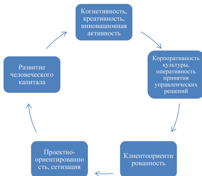
Рис. 5. Факторы конкурентоспособности организаций в цифровой экономике

Ведущие экономики определили основные задачи при формировании цифровой платформы, а это обуславливает абсолютизацию всех сфер бизнеса. Появление цифровых игроков уже изменило облик целых отраслей – туристической, телекоммуникационной, полиграфической, пассажирских перевозок (услуги такси) и т. д. Необходим системный комплексный подход с применением инноваций, который помогает улучшить деловой и инвестиционный климат – благодаря повышению доступности и эффективности государственных услуг в существующих условиях (рис. 5).