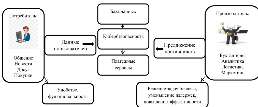
Рис. 2. Концентрация экономической деятельности на платформах цифровой экономики