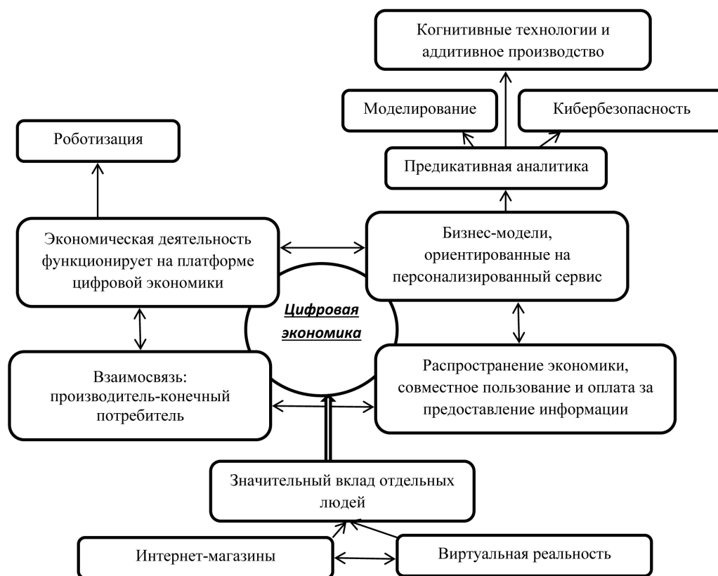
Рис. 4. Цифровая трансформация экономики – важнейший рычаг дальнейшего повышения производительности труда в России

Факторами, оказывающими влияние на рост национальных экономик, являются расширение сферы рыночных услуг, рост, как внутриотраслевой конкуренции, так и конкуренции экономических отраслей отдельных стран в масштабе мировой экономики. Те экономические субъекты, которые активно осваивают новые цифровые инструменты и методы, получают ощутимые финансовые результаты (рис. 4).