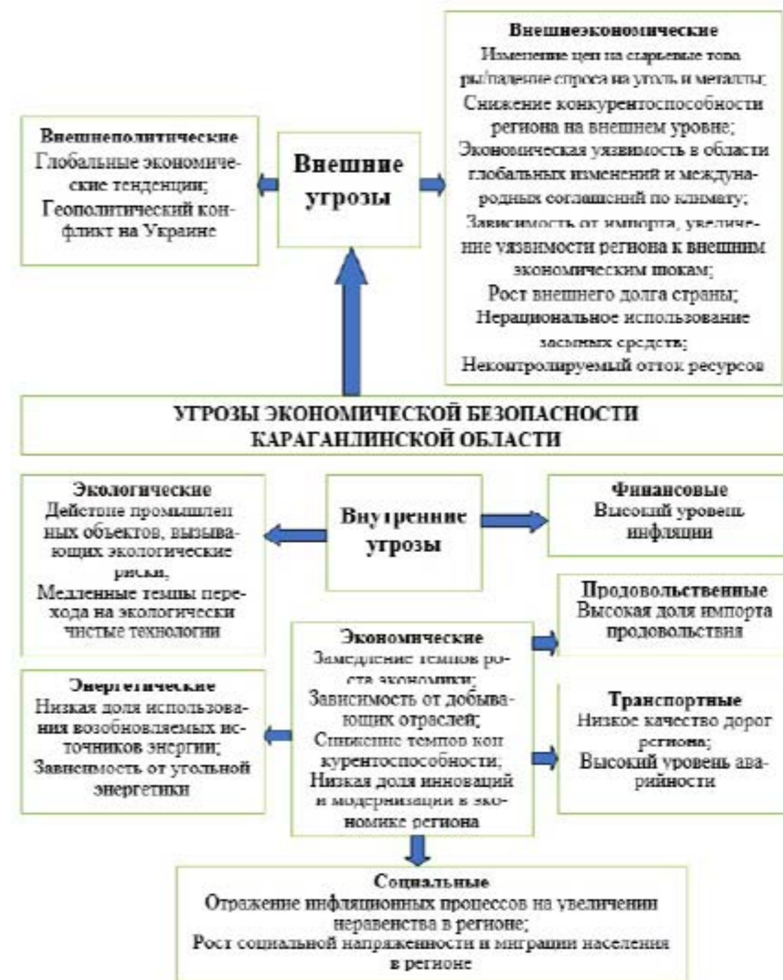
Рис. 3. Угрозы экономической безопасности Карагандинского региона

Исходя из представленных данных, видно, что угрозы экономической безопасности Карагандинской области можно отразить следующим образом (рис. 3)