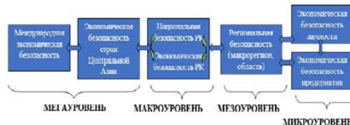
Рис. 1. Уровни экономической безопасности Республики Казахстан

Можно выделить следующие уровни экономической безопасности Республики Казахстан (см. рис. 1).