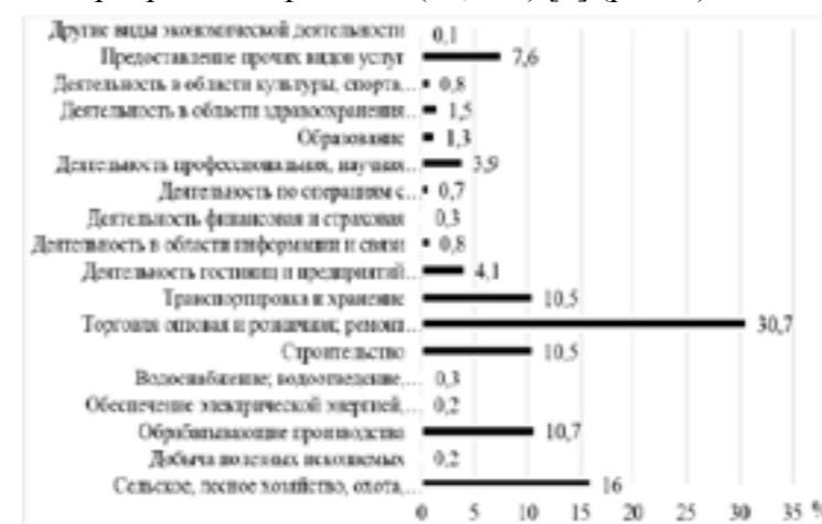
Рис. 2. Удельный вес численности занятых в неформальном секторе по видам экономической деятельности за 2021 год

Если рассматривать структуру занятых в неформальном секторе по видам экономической деятельности, то можно сделать вывод, что в топ отраслей с высоким процентом теневых отношений входят оптовая и розничная торговля, ремонт автотранспортных средств и мотоциклов (30,7 % от общего числа занятых в неформальном секторе); сельское, лесное хозяйство, охота, рыболовство и рыбоводство (16 %); обрабатывающая промышленность (10,7 %); строительство (10,5 %); транспортировка и хранение (10,5 %) [6] (рис. 2).