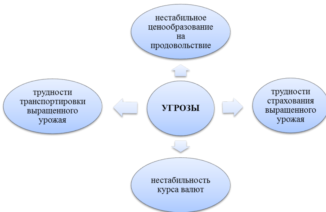
Рис. 1. Текущие угрозы для российских сельскохозяйственных производителей