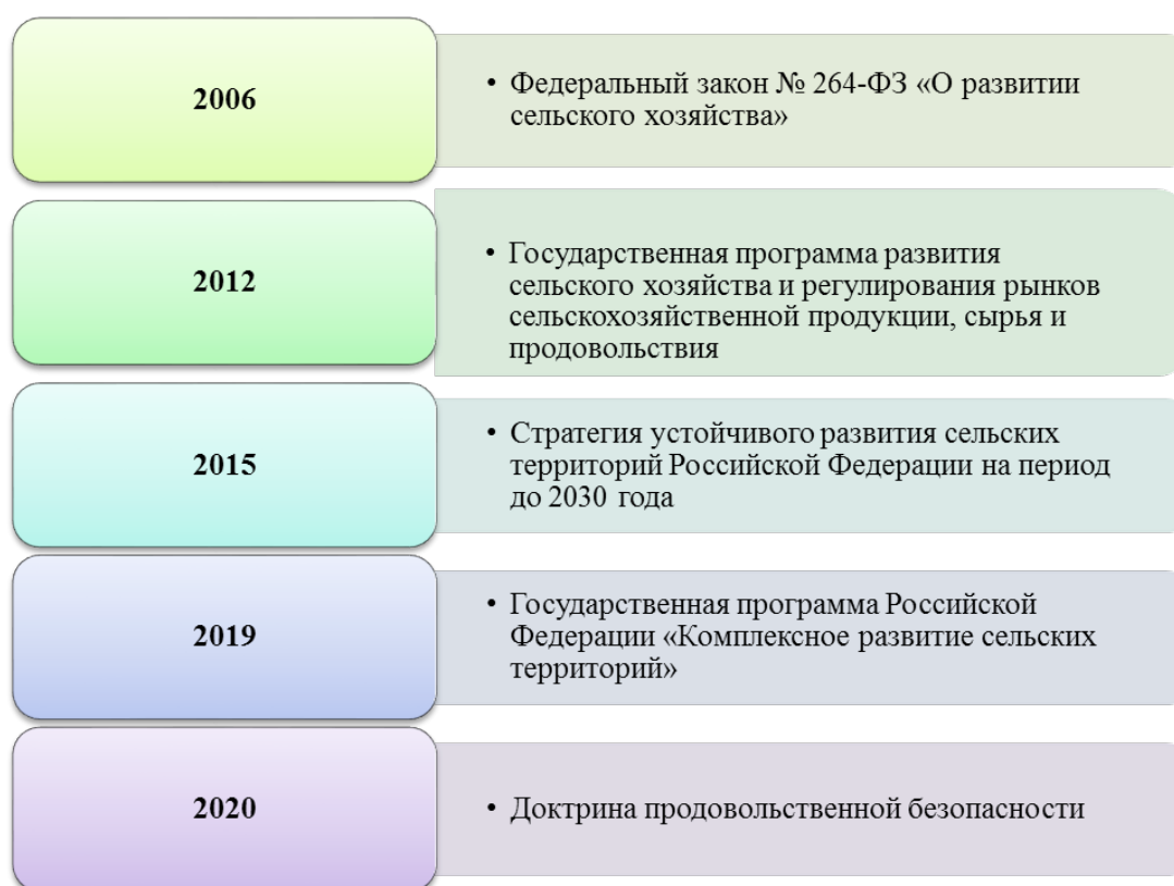
Рис. 2. Нормативно-правовой базис продовольственной безопасности России

На рисунке 2 перечислен нормативно-правовой базис продовольственной безопасности России.