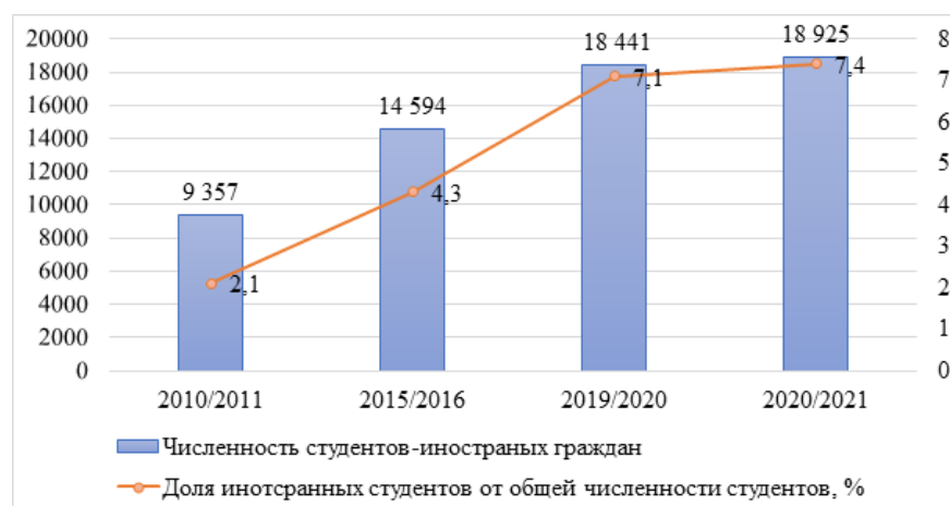
Рис. 1. Численность и доля иностранных граждан среди общего числа студентов Fig. 1. The number and proportion of foreign citizens among the total number of students

Белорусские высшие учебные заведения также должны прилагать образовательные усилия, если они хотят привлечь больше студентов со всего мира. И все же позитивные тенденции в белорусской студенческой среде имеются. Так, начиная с 2010 года численность студентов — иностранных граждан в учреждениях высшего образования (на начало учебного года) постоянно росла, вплоть до 2020 / 2021 учебного года (рис. 1) [2]. А на начало учебного года 2021 / 2022 численность иностранных студентов (вместе с обучающимися на подготовительных факультетах вузов) составила порядка 27 тыс. человек.