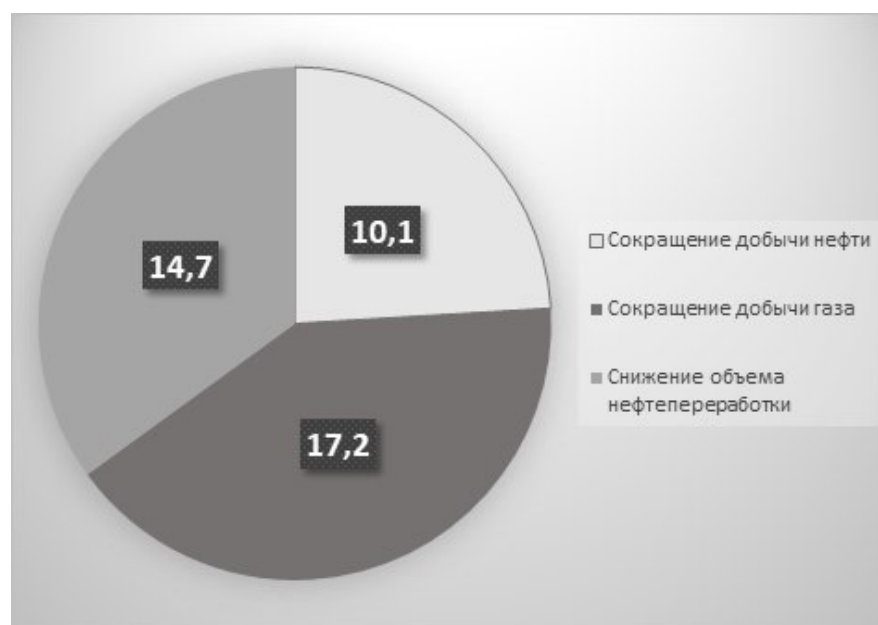
Рис. 2. Влияние COVID-19 на результаты деятельности ПАО «Лукойл» Fig. 2. The impact of COVID-19 on PJSC LUKOIL's performance

В 2020 году, по сравнению с 2019 годом, ПАО «Лукойл» уменьшил добычу нефти на 10,1 %, газа — на 17,2 %, объем нефтепереработки — на 14,7 %.