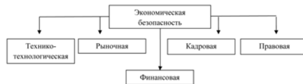
Рис. 1. Составляющие экономической безопасности организации

Наиболее распространенным подходом к анализу структуры экономической безопасности является разделение ее на отдельные виды. Совокупность отдельных видов экономической безопасности образует ее функциональную структуру (рис. 1) [2, с. 65].