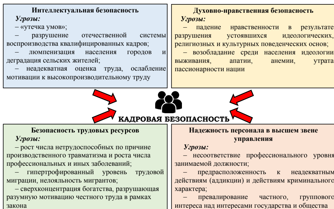
Рис. 2. Составляющие и угрозы кадровой безопасности