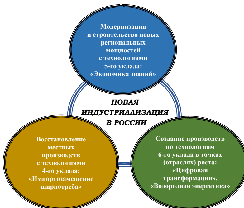
Рис. 3. Составляющие «новой индустриализации»

По пункту I. В силу особенностей России-цивилизации без возрождения малых городов, опираясь лишь на агрессивно-урбанистическую модель, устойчивый социально-экономический рост страны невозможен. Базой восстановления и развития существующих малых городов и сел являются местные производства по импортозамещению продовольственных товаров и товаров широкого потребления с опорой на артели, кооперативы, народные предприятия и пр. В этом может пригодиться как богатый опыт местных (по закону находящихся в ведении местных советов) артельных предприятий 1930-х — 1950-х годов СССР, так и современный опыт муниципальных народных предприятий Германии и Италии. В этих целях в ближайшие 10—20 лет производства на основе технологий 4-го уклада будут вполне востребованными.