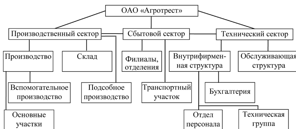
Рис. 1. Функционально-процессная модель организационной структуры ООО «Агротрест»

Управление экономической безопасностью организации – это деятельность на основе совокупности взаимосвязанных функций нормирования, планирования, организации, учета, контроля, анализа, регулирования, координации, обеспечивающих управленческий цикл процесса защиты экономических интересов рассматриваемой организации [7; 8].