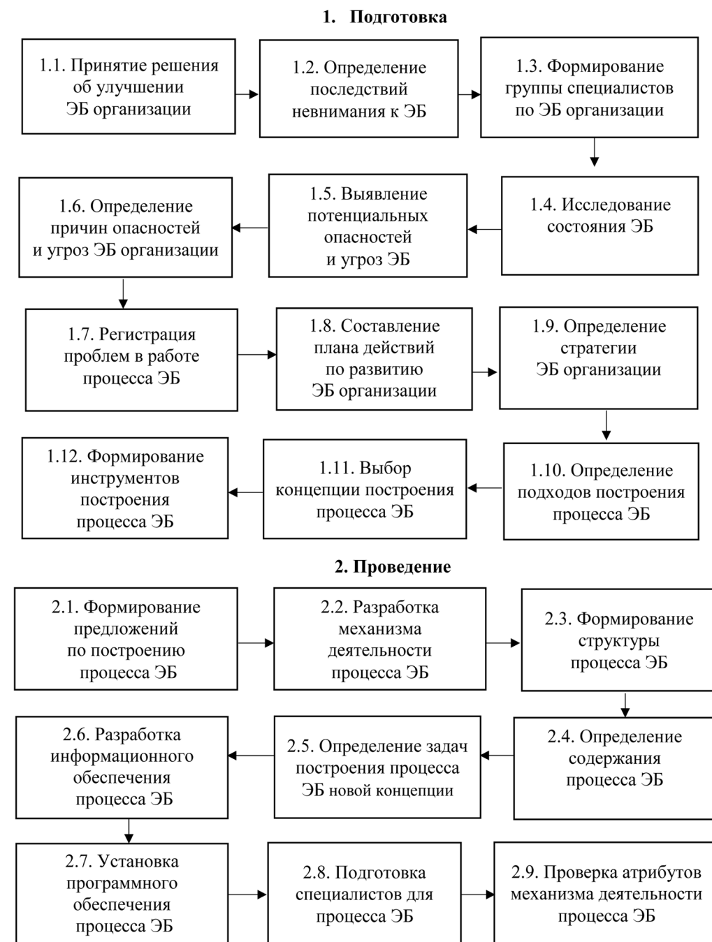
Рис. 3. Технология развития процесса экономической безопасности организации (фрагмент)

В процессе исследования базовой организации были выявлены такие проблемы, как: нехватка работника в отделе экономической безопасности, утечка части информации о банковских переводах, недостаток финансов для полной реализации программы экономической безопасности, невозможность обновить систему безопасности, путаница в данных организации, получение уведомления о проверке государственными органами, шантаж от конкурентов.