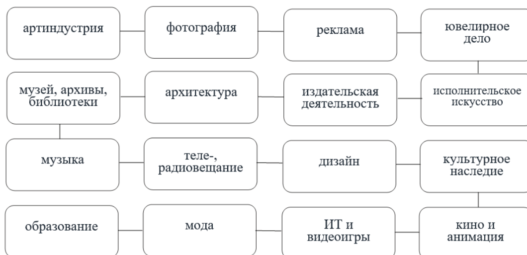
Рис. 2. Перечень объектов творческих (креативных) индустрий

Составляющие элементы креативной экономики, включающие в себя творческие и инновационные отрасли, такие как музыка, кино, дизайн, игры, архитектура, реклама и другие, которые являются объектами творческих (креативных) индустрий, представлены на рис. 2.