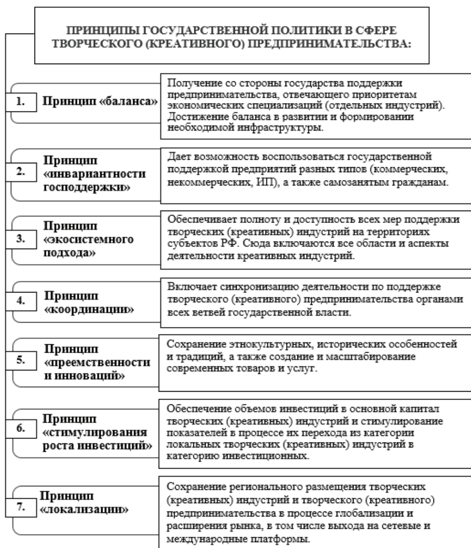
Рис. 1. Принципы государственной политики в сфере креативного предпринимательства