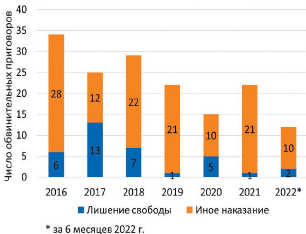
Рис. 1. Статистика обвинительных приговоров по статье 196 УК РФ (составлено автором на основе [8])

При этом статистика привлечения лиц к ответственности свидетельствует о том, что статья УК РФ практически не применяется. Очевидна и динамика на снижение числа обвинительных приговоров. Кроме того, не велика доля лиц, осужденных на реальное лишение свободы. Все это не коррелирует с описанной выше общественной опасностью и ущербом для экономики страны, оцениваемым в триллионы рублей.